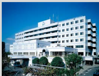
医真会八尾総合病院