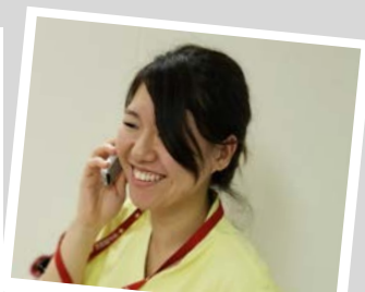
自然と笑顔になれます