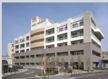
介護老人保健施設あおぞら