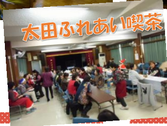
太田ふれあい喫茶