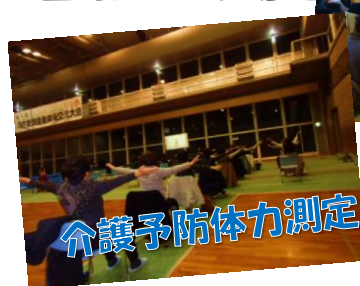
介護予防体力測定